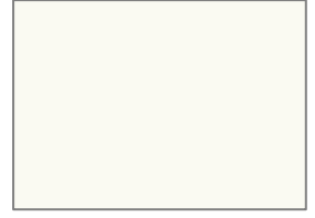
L8 MINERAL EGG