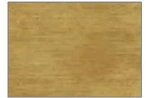
F4 AGED GOLD LEAF