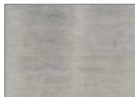
F6 DARK AGED SILVER LEAF