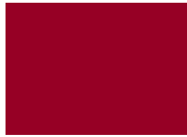
L11 CHERRY RED