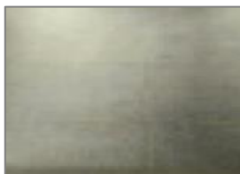
F1 SILVER LEAF

Sólo para detalles / only for details / seulement pour détails