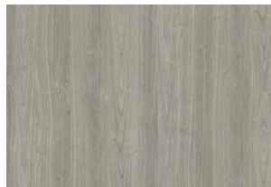
06 SILVER GIGLIO WOOD