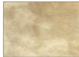
F3 AGED SILVER LEAF