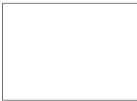
L1 ALPINE WHITE