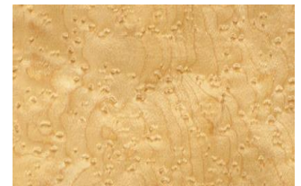
08 BIRDS EYE