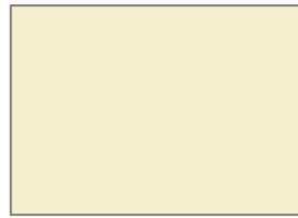
L3 NUT MEG