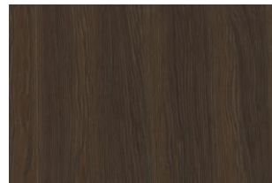
07 SMOKED OAK